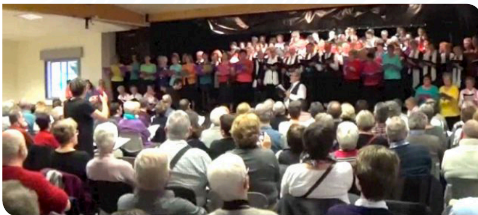
Une salle comble pour cette 5 ème édition.

Dimanche 13 mars à 16h au foyer municipal LE MEUNIER, les chorales « Andante-Chantdalloues » d'Auxerre, « Si ça vous chante » d'Aillant-sur-Tholon et la chorale l'Amitié de Gurgy ont uni leurs voix lors du concert donné comme chaque année au profit de la recherche contre le cancer.