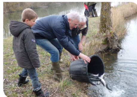
L'empoissonnement par l'amicale des pêcheurs.

Comme tous les ans pour l'ouverture de la truite début mars, l'amicale des pêcheurs de Gurgy a procédé, le vendredi 11 mars, à l'empoissonnement de 55 kg de truites arc-en-ciel représentant 170 poissons dont plusieurs pesant plus de trois livres. Une réglementation particulière a été mise en place, cette année, pour cette ouverture avec la limitation de 4 truites par pêcheur et par jour ainsi que la limitation à une canne par pêcheur avec permis et un enfant de moins 10 ans accompagné d'un adulte.