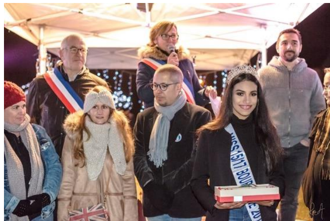
Vœux de la municipalité, 30/12/18