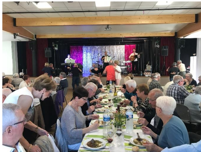
Repas fleur de l'âge