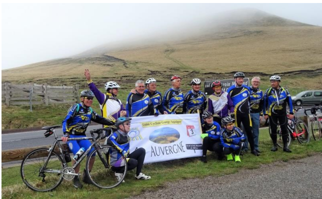
L'arrivée en haut du Col de la Croix Morand.

L'UCGA organise le 1 er juin la 2 ème manche du Challenge Jean Pierre Dabet. Départ de la salle des sports à Appoigny. Information sur le site de l'UFOLEP Yonne. http://www.ufolepyonne.org