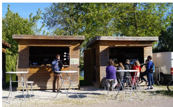
Les chalets de l'escale

Ouverture tous les jours à partir de 17h30