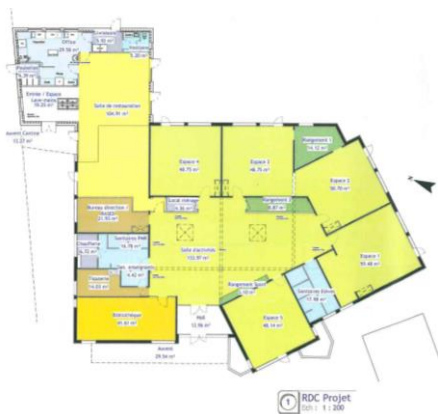
Plan de restructuration du groupe scolaire (école élémentaire)

Ces plans sont également disponibles sur le site internet de la commune ( www.gurgy.net rubrique enfance > écoles).