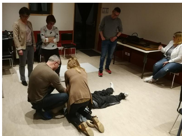
Formation sur les premiers gestes de secours