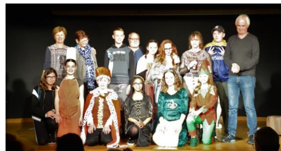
L'atelier jeunes Amphithéâtre