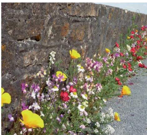
Fleurs en pied de mur

Si vous souhaitez vous engager dans cette démarche, la commune met à disposition gracieusement des sachets de graines de diverses espèces de fleurs (bleuet, souci, lin...) à venir récupérer en mairie (aux horaires d'ouverture). Nous apporterons des conseils et aide à la plantation à travers un livret disponible en mairie.