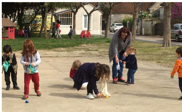
La chasse aux œufs – Place de la rivière

Pour la deuxième année, le CCAS a organisé une chasse aux œufs. Cette manifestation qui s'est déroulée le 22 avril sous le soleil, Place de la Rivière, a attiré environ 50 enfants accompagnés par leurs parents. Pendant la chasse aux œufs, les membres du CCAS offraient un café aux parents. Les œufs ont été cachés par le Conseil Municipal des Jeunes. Chaque enfant est reparti avec un sachet de chocolats. Les sachets restants ont été distribués le mardi aux enfants des familles qui bénéficient du panier solidaire.