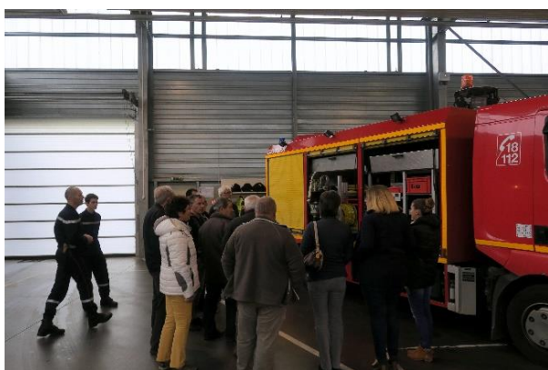
Visite de la Caserne de pompiers d'Auxerre

Enfin, je profite de cette occasion, pour informer les Gurgycois qu'un exercice d'alerte sera organisé prochainement pour en tester l'efficacité.