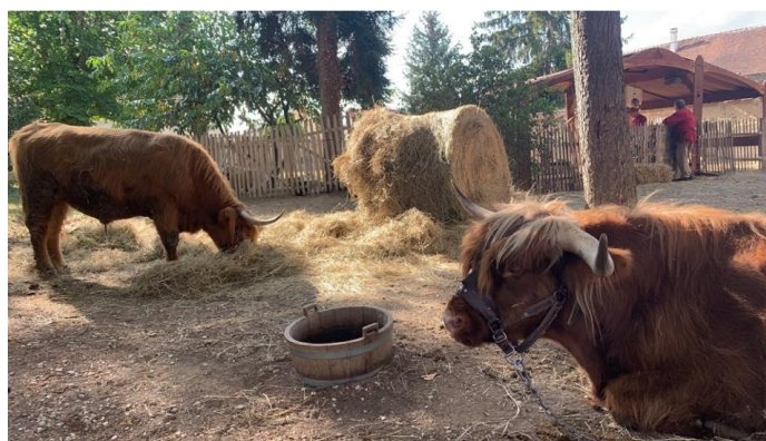
La ferme du moyen âge s'invite à la MDJ