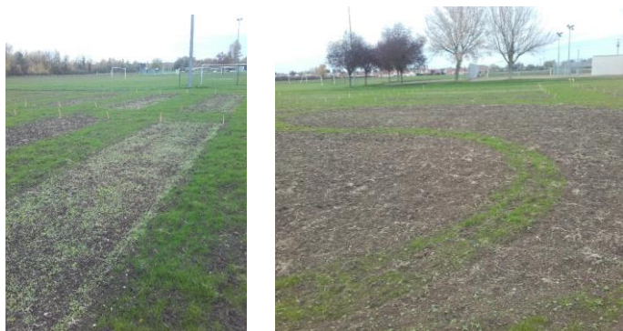
Jachères fleuries au pôle sportif

Lors du précédent GURGY INFOS, il a été évoqué le partenariat avec Nova Flore et Naturalis, pour la mise en place d'une plateforme fleurie au pôle sportif. Différents types de jachères fleuries ont été semés pour une floraison à partir du printemps. Dans certaines, un mélange de bulbes a été planté. Les jachères devront être entretenues durant l'automne et l'hiver pour donner entière satisfaction. La pelouse située juste à côté de cette plateforme va être plantée de 3000 bulbes de 5 mélanges différents et cela pour le plus grand plaisir des yeux. Le rendez-vous est donné au printemps pour admirer le rendu.