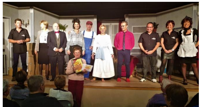
La remise des récompenses au 40 000ème spectateur, lors de la représentation du 10 novembre 2019

Ainsi dès la fin du mois, les enfants de l'école maternelle iront au théâtre d'Auxerre, Amphithéâtre aura permis de boucler le budget nécessaire.