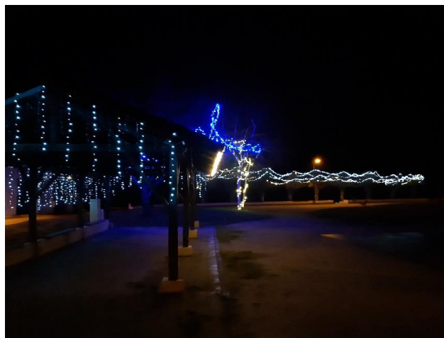
La Place de la rivière illuminée