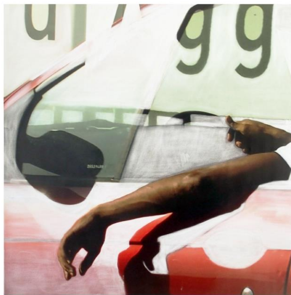
Habitants sur route 1-2019, 90x60cm