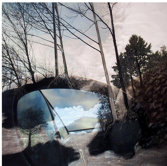
Fenêtre sur route GF 12-2015

Par le trajet de l'automobile en mouvement, une dimension spatio-temporelle est de fait incluse car il y a dans chaque tirage, l'image du chemin parcouru combiné au paysage vers lequel le véhicule se dirige. Après une sélection de ses prises de vue, Aline Isoard retravaille les tirages numériques qu'elle a effectués. Elle fait subir à leur couche pigmentaire des opérations manuelles pour supprimer, aussi bien que pour les révéler, des détails, des éléments graphiques, mais également afin d'atténuer des couleurs ou des contrastes... Jacques Py, commissaire de l'exposition