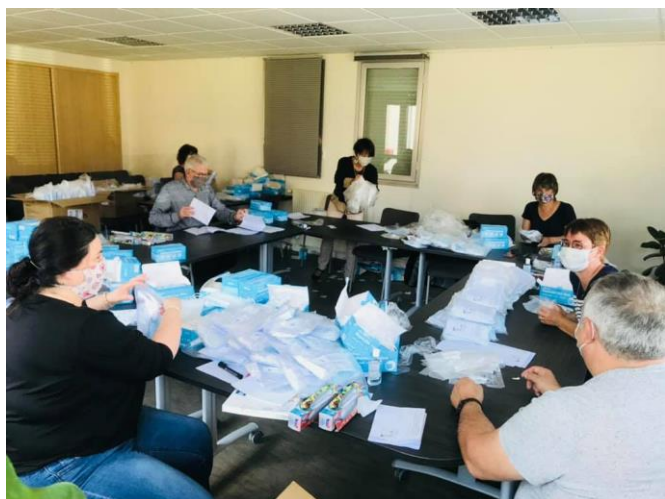
Mise en sachet des masques pour distribution à la population