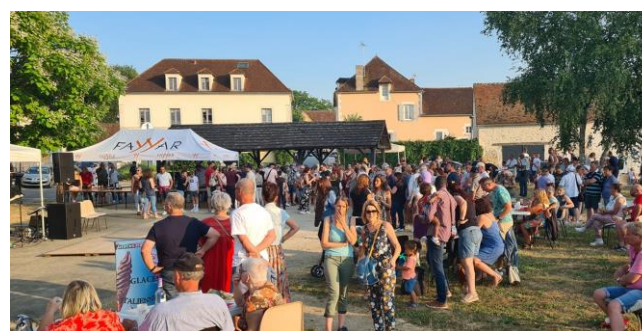
Apéro concert du vendredi 16 juin 2023