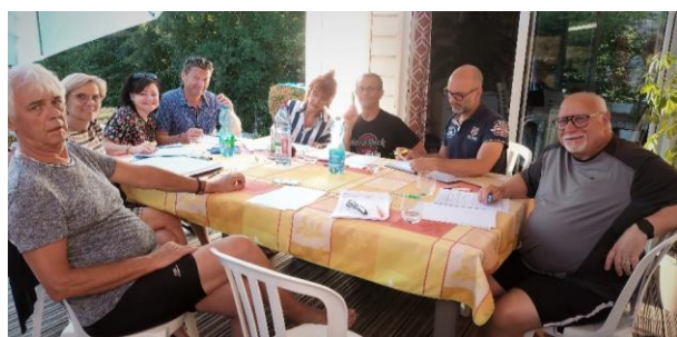
Répartitions des rôles et première lecture de la pièce « ça se complique »

Les dimanches 4, 12, 19, 16 novembre et 3 décembre ainsi que le vendredi 24 novembre.