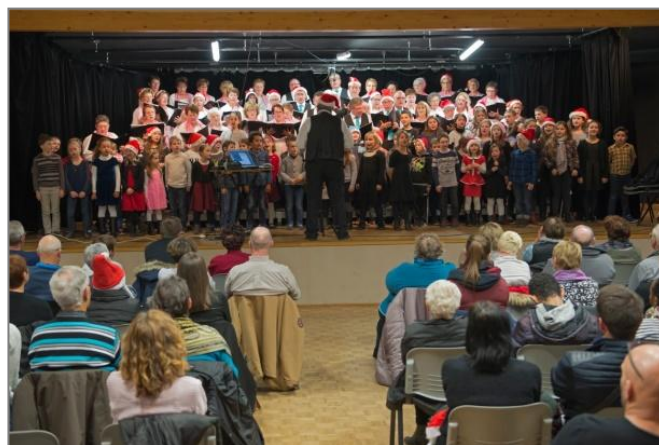
Noël 2016 au foyer

Soyez nombreux à venir les écouter, chanter avec eux et surtout les encourager et les applaudir.