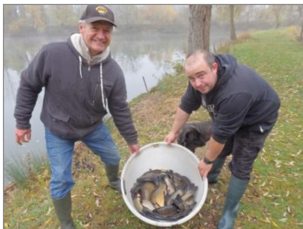
L'empoissonnement de l'étang

GRATUIT Pour les enfants de moins de 10 ans de la commune accompagnés d'un Adulte.